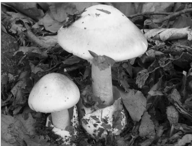
Bild 1: Grüner Knollenblätterpilz, tödlich giftig!

Horst Mildner Försterbauerweg 8 09579 Grünhainichen / Ortsteil Borstendorf Tel. privat: 037294/90295