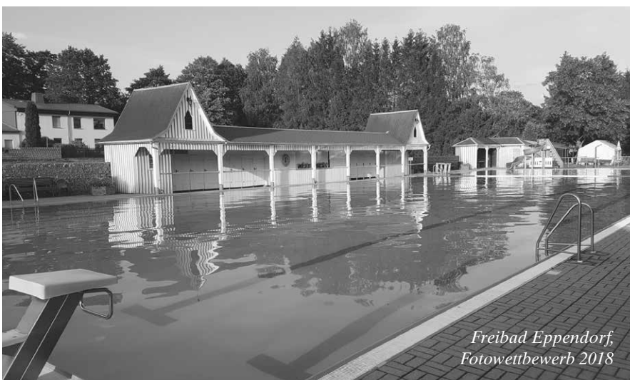
Freibad Eppendorf, Fotowettbewerb 2018

Wir wünschen allen Leserinnen und Lesern einen schönen und erholsamen Sommer.