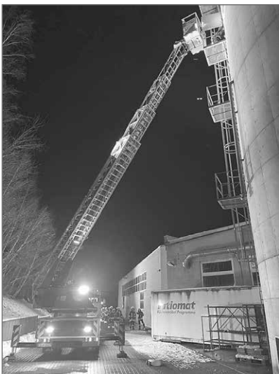
23.01.2023 Ratiomat, Leubsdorf

17.01.2023 abends: bewusstlose Person, Oederaner Straße, Eppendorf (First Responder Eppendorf)